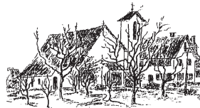
Heimgarten, St. Josef Hersberg (Brettern)

Sonntag, 27. März 2022, 4. Fastensonntag um 10.45 Uhr Eucharistiefeier - 17.30 Uhr Eucharistiefeier