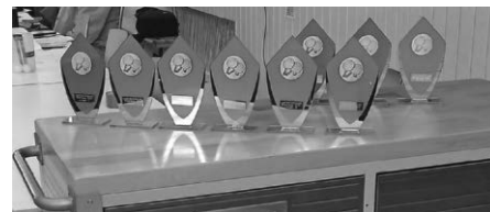
Neun Pokale gab es bei der Jugendendrangliste abzustauben.