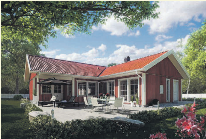
Das klassische Schwedenrot der Holzfassade ist ein bekanntes Symbol für den skandinavischen Baustil.

Der Hersteller Danwood zum Beispiel bietet mit transparenten Preisen und einer mehrmonatigen Festpreisgarantie hohe Planungs- und Kostensicherheit. Die eigentliche Bauphase ist kurz: So steht der Rohbau bereits nach zwei Tagen, der schlüsselfertige Ausbau ist innerhalb weniger Wochen abgeschlossen. Energiesparteknik mit einer Wärmepumpe und optional einer Fotovoltaikanlage samt Batteriespeicher sorgt für dauerhaft niedrige Verbrauchskosten.