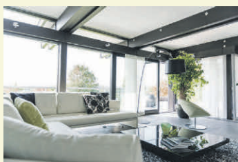
Wohnen mit Ausblick: Glasspielt in der modernen Architektur eine weiter wachsende Rolle.

Glas spielt in der zeitgemäßen Architektur eine weiter wachsende Rolle