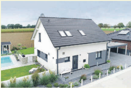
Mit Fertighäusern und einer guten Planung bleibt der Traum vom Eigenheim im Grünen realisierbar.

Mit dem passenden Konzept lässt sich der Traum vom Eigenheim noch verwirklichen