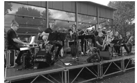
Do-X-Memorial Bigband 2021 im Aquastaad

Freuen wir uns gemeinsam auf einen tollen Abend