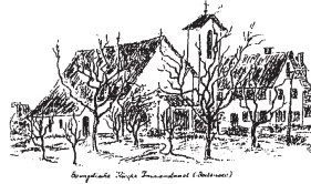
Bergische Haupt- und Residenzstadt (Witten)