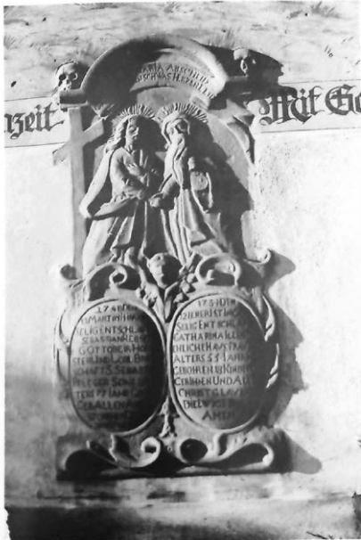
Grabdenkmal an der St. Jodokus-Kirche, Südwand

Das aus graugrünem Sandstein gefertigte Grabdenkmal von Hofmeister Sebastian Rebstein befindet sich heute auf der Ostseite der Apsis der katholischen Pfarrkirche St. Jodokus. Ursprünglich befand sich diese Erinnerungstafel auf der Südseite der Kirche, westlich neben dem Haupteingang auf Flurstück 192 an der Meersburger. Google 47.6655120/ 9.3638650