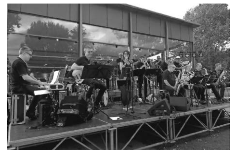
Do-X-Memorial Bigband im Aquastaad 2021

Zum 33. Mal veranstaltet der Heimatverein zusammen mit der Do-X-Memorial-Big- band die weithin bekannte und beliebte Jazz-Night im Strandbad Immenstaad, dem Aquastaad.