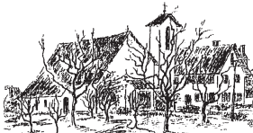
Bergstraße, St. Josef Hersberg (A. H. Müller)

Sonntag, den 28. Juni 2020, 13. Sonntag im Jahreskreis um 10.45 Uhr Eucharistiefeier - 17.30 Uhr Vesper