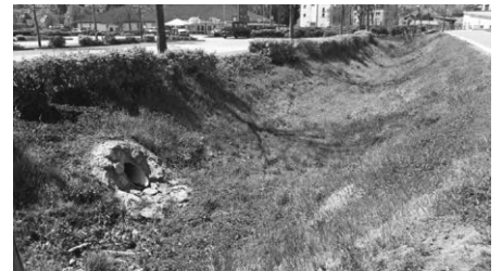
Beispiel Wassermanagement: Retentionsmulde zum Sammeln und Versickern von Wasser.