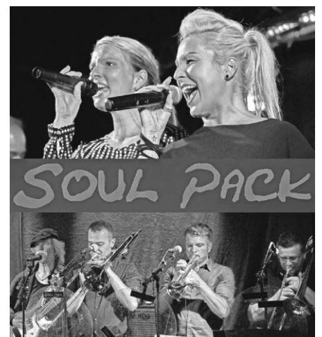
Soul Pack aus Ravensburg

Wir wünschen uns rundum gutes Wetter und freuen uns auf zahlreiche Besucher. Ihr Heimatverein Immenstaad