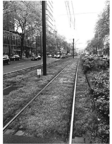
Beispiel: Begrünung von Verkehrsflächen.