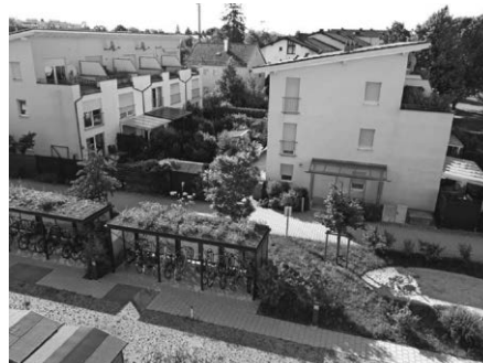
Beispiel: Begrünung von Verkehrsflächen.

https://www.lubw.baden-wuerttemberg.de/klimawandel-und-anpassung