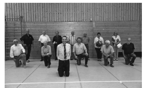
Ehrungen beim TuS Immenstaad (mit Coronaabstand)