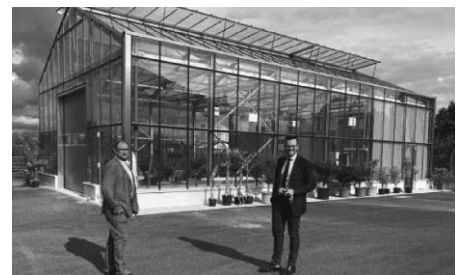
Besichtigung des Gewächshauses des neuen Immenstaader Bauhofs