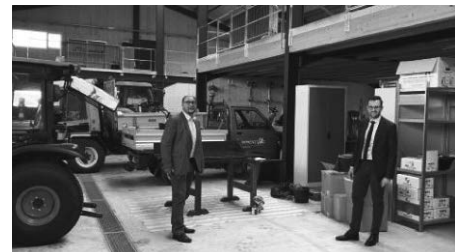
Besichtigung des neuen Immenstaader Bauhofs - Werkstattbereich