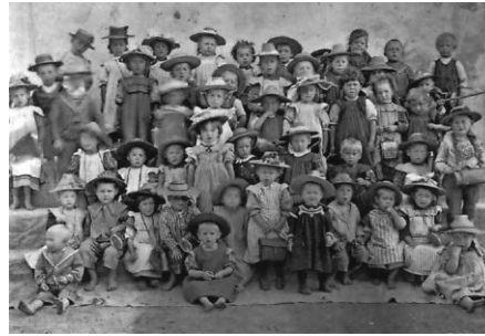
Alte Kindergruppe

Wir freuen uns auf viele Interessierte und einen vollen Bürgersaal. Ihr Heimatverein