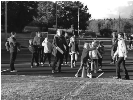
Voller Einsatz beim Drehwurf