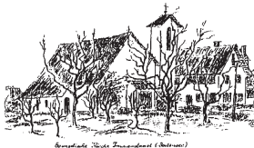
Evangelische Kirche Immenstaad (Historisch)

Freitag von 19:00 Uhr bis 19:30 Uhr Stille Anbetung