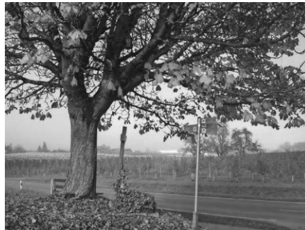
Bunter Laubteppich unterm Kastanienbaum

Bäume vom goldenen Herbst. Noch sind vereinzelt Blätterteppiche unter den Bäumen in den verschiedensten Farben herrlich anzusehen. In denjenigen der weißblühenden Kastanie – nicht der rot- und gelbblühenden – haben sich leider seit Jahren die Larven der Minier-Motte eingenistet. Diese fliegen im fortgeschrittenen Stadium im Frühjahr als Motte in den Kastanienbaum und zerfressen die Blätter von Innen her. Neben dem Baumstress durch Streusalze und Luftschadstoffe wird die Photosynthese des Baumes durch die Zerstörung der Blattzellen beeinträchtigt, was zu vorzeitiger Braunfärbung und Entlaubung führt. Die Beseitigung und Verbrennung der abgefallenen Blätter sowie das Aufhängen von Meisen-Nistkästen schafft Abhilfe. Die Nisthilfen kommen somit der weißblühenden Kastanie und den Meisen zu Gute. An beiden erfreuen wir uns das ganze Jahr über! Wer beim Aufhängen von Nistkästen und Säubern im Frühjahr mitmachen will, kann sich beim BUND-Vorstand unter 2234 oder 911155 melden.