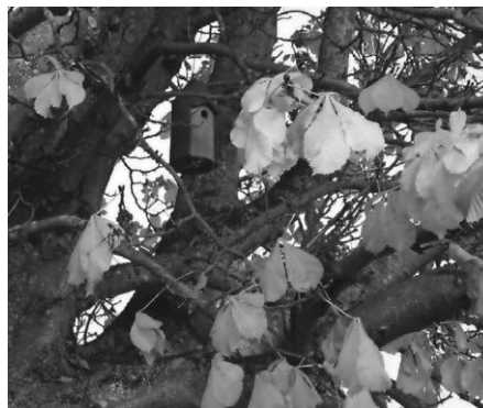
Nistkasten im Kastanienbaum