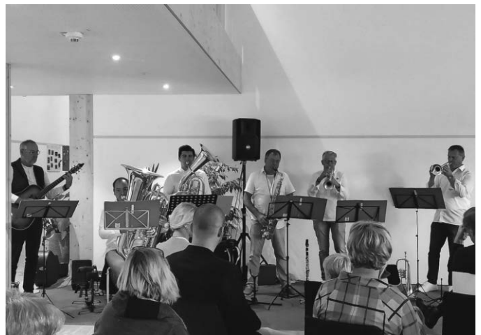
Die Chicken Sledge Gumpers sorgten für fröhliche Stimmung