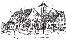
Angelika Bauser-Eckstein (Illustration)