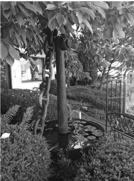
Pilzanker, ca. 2 Tonnen, diente zur Verankerung von Feuerschiffen

Einer dieser Bauart zielt nun das Vorgartenbeet von 3,20 x 4,90 m, welches mit einem Schiffsseil eingegrenzt ist.