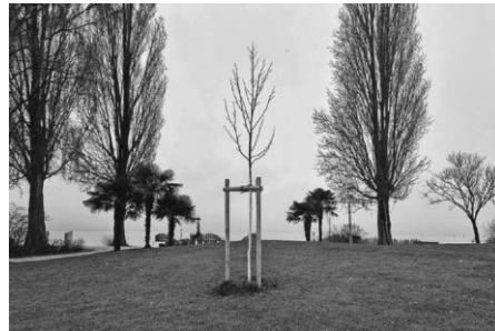
Tulpenbaum an der Landestelle

Die Plaketten werden in nächster Zeit noch an den Bäumen, an denen dies gewünscht wurde, angebracht. Für die Überreichung der Urkunden werden alle Spender noch zu einem gemeinsamen Termin eingeladen. Wer an diesem Termin nicht teilnehmen kann, erhält die Spenderurkunde mit der Post.