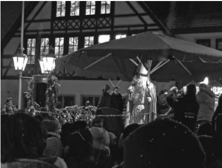
Über den Besuch vom Nikolaus und seinen Begleiter Knecht Ruprecht freuten sich viele Kinder.