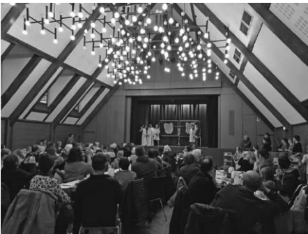
Bei Kaffee und Kuchen im Bürgeraal konnte die Theater-Aufführung der Stephan-Brodmann-Schule verfolgt werden.