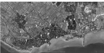
Standorte der neu gepflanzten Bäume

29 Spender sind dem Aufruf der Gemeindeverwaltung Immenstaad zur Baumpflanzaktion gefolgt und haben insgesamt 34 Bäume gespendet. Die Bäume wurden, mit wenigen Ausnahmen, zwischen dem 23. und 29. November an verschiedenen Standorten im gesamten Gemeindegebiet gepflanzt.