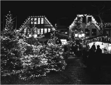
Der Weihnachtsmarkt war wunderbar stimmungsvoll beleuchtet.