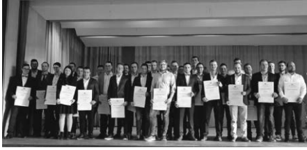
Gruppenbild Landwirtschaftsmeisterin und -meister

und sichert damit zugleich eine wichtige Grundlage für Naturschutz und Tourismus.