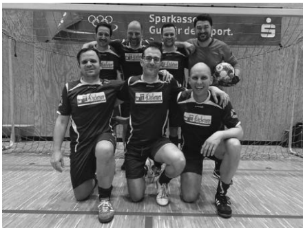
Diese Sieben sprangen gerade so hoch wie sie mussten