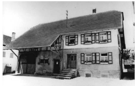
Bauernhaus im Wattgraben von 1960