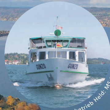
Schiffahrtsbetrieb Heidi - MS Gunzo

Abfahrtszeiten: ab Immenstaad 10:00 Uhr ab Hagnau 10:25 Uhr ab Meersburg 10:45 Uhr