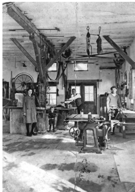
1928 Zimmerei Glatthaar mit Kind Karl