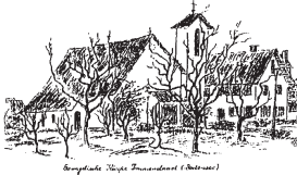
Evangelische Kirche Immenstaad