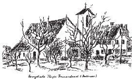
Evangelische Kirche Immenstaad (Astram)

Кожну 3-тю середу місяця о 18.30 год Усі тексти та пісні також перекладені українською мовою.