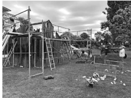
Renovierung der Fischerhütte