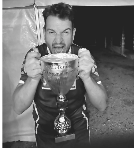
Das ist das Ding!

Durch eine ... bei aller Bescheidenheit ... durchweg grandiose Vorstellung sicherte sich die AH den Turniersieg beim 1. Josef-Mutter-Pokal-Turnier in Deggenhausertal. Aber damit konnte man vor Turnierbeginn so überhaupt gar nicht rechnen.