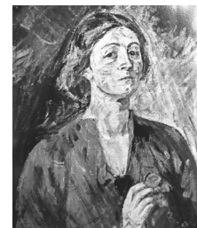
Rose Sommer-Leypold