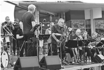
Tolle Stimmung mit der Do X Memorial Bigband

Freuen wir uns auf das 35. Konzert der Do X Memorial Bigband im nächsten Jahr! Ihr / Euer Heimatverein