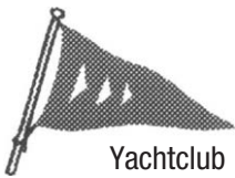
Yachtclub Immenstaad e.V.

Der Bus kann für eine begrenzte Zahl Rollstuhlfahrer umgebaut werden. Allerdings verschieben sich dann die Zusteigezeiten für jeden Rolli um einige Minuten. Wir bitten bereits im Vorfeld um entsprechende Berücksichtigung