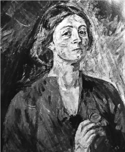
Rose Sommer-Leypold