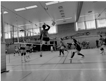
Spiel gegen SV Eglofs: erfolgreicher Angriff der Damen 1

Im 2. Spiel hieß es gegen die Tabellenersten aus Eglofs das ganze Können zu zeigen und den Gegnerinnen so viele Punkte wie möglich zu klauen. Gleich im 1. Satz gewannen die Gastgeberinnen das „Kopf an Kopf-Rennen“ und zeigten den Gegnerinnen, dass sie nicht zu unterschätzen sind. Im 2. Satz konnte an die Leistung nicht sofort angeschlossen werden und so hieß es abhaken und volle Konzentration auf die nächsten Sätze. Knapp und hart umkämpft mussten sich Damen 1 aber auch in diesen Sätzen geschlagen geben. Zeit durchzuatmen bleibt nur wenig, denn bereits in einer Woche geht es zum Auswärtsspiel nach Kressbronn.