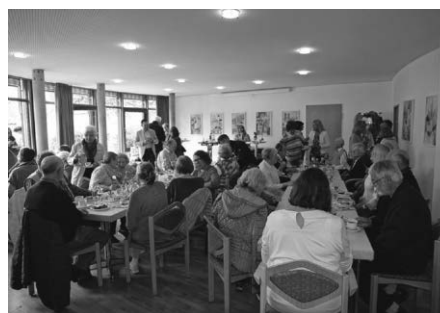
Das Café klang gemütlich und voller angeregter Gespräche aus. Die Vorfreude auf das nächste Markt-Café am Mittwoch war deutlich zu spüren.