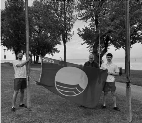
Hissen der Flagge im Aquastaad