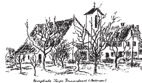
Skulptur: Heilig Immenstaad