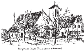
Evangelische Kirche Immenstaad (Abitz)

Усі тексти та пісні також перекладені українською мовою.