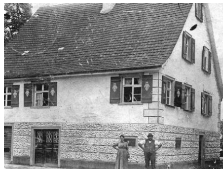
Haus Bauer in der Seestraße

Vorankündigung Der Heimatverein lädt ein Im Rahmen seiner Bildvortrags-Reihe zeigt der Heimatverein Immenstaad Seestraße. Ein Leben lang! am Mittwoch, den 17. April 2024 um 19.00 Uhr im Bürgersaal Heinz Bauer, als „Ureinwohner“ der See- straße, wird uns auf eine kleine Zeitreise mitnehmen in die Straße in der er auf- gewachsen ist und bis heute wohnt. Seien Sie gespannt auf einen Abend mit alten Bildern, netten Anekdoten und vie- len Hintergrundinformationen aus vergan- genen Tagen. Der Eintritt ist kostenlos. Wir freuen uns über eine Spende für die Renovierung und Einrichtung unseres „Kulturhäusles“, die ehemalige Ausseg- nungshalle am alten Friedhof. Ihr/Euer Heimatverein