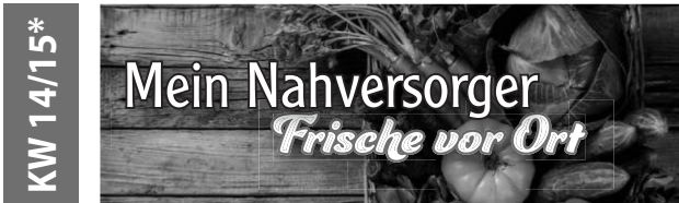
* KW15: Pattonville, Biberach, Hochdorf, Bad Waldsee und Weingarten

Veröffentlichen Sie jetzt Ihre Anzeige auf unseren Sonderseiten um Ihr Unternehmen werbewirksam zu präsentieren.