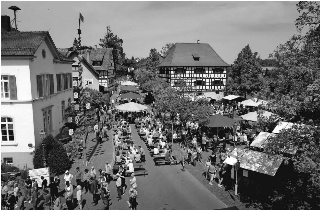
Geselliges Maifest auf dem Dorfplatz in Kippenhausen.