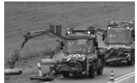
Die Mäharbeiten an den Bundesstraßen dienen der Verkehrssicherheit.

Von Montag, 13. bis voraussichtlich Donnerstag, 23. Mai 2024 jeweils ab 19 Uhr kommt es auf der B31 von Überlingen bis zur Landesgrenze bei Kressbronn in beiden Fahrrichtungen zu Verkehrsbehinderungen. Grund sind Mäharbeiten an den Randstreifen, die für die Verkehrssicherheit nötig sind. Um die Einschränkungen möglichst gering zu halten, finden diese Arbeiten in den Abendstunden statt und das Straßenbauamt des Bodenseekreises setzt gleichzeitig zwei Unimogs mit automatisierten Mähergeräten ein.