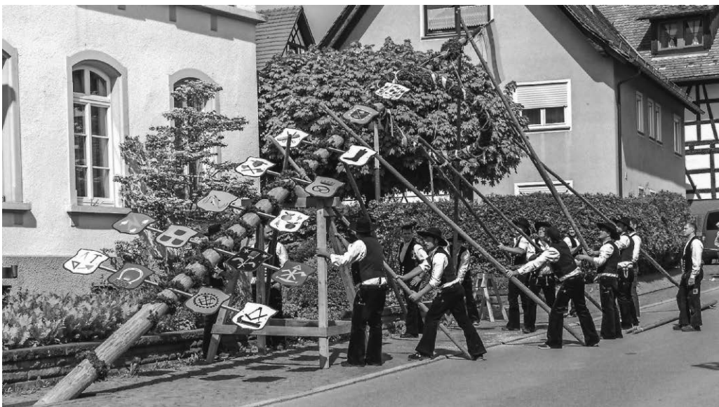
Die Zimmermänner stellen den Maibaum mit gekonnten Handgriffen.