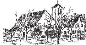
Beispiel: Sage Truandant (Antenne)

Sonntag, den 04. Februar 2024 am 5. Sonntag im Jahreskreis um 10.45 Uhr Eucharistiefeier - 17.30 Uhr Vesper