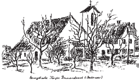
Singende Stimmen (Bühnen)

Усі тексти та пісні також перекладені українською мовою.