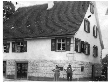
Das Haus der Familie Bauer in der Seestraße 1914

Wir freuen uns über eine Spende für die Renovierung und Einrichtung unseres „Kulturhäusles“, die ehemalige Aussegnungshalle am alten Friedhof. Ihr/Euer Heimatverein