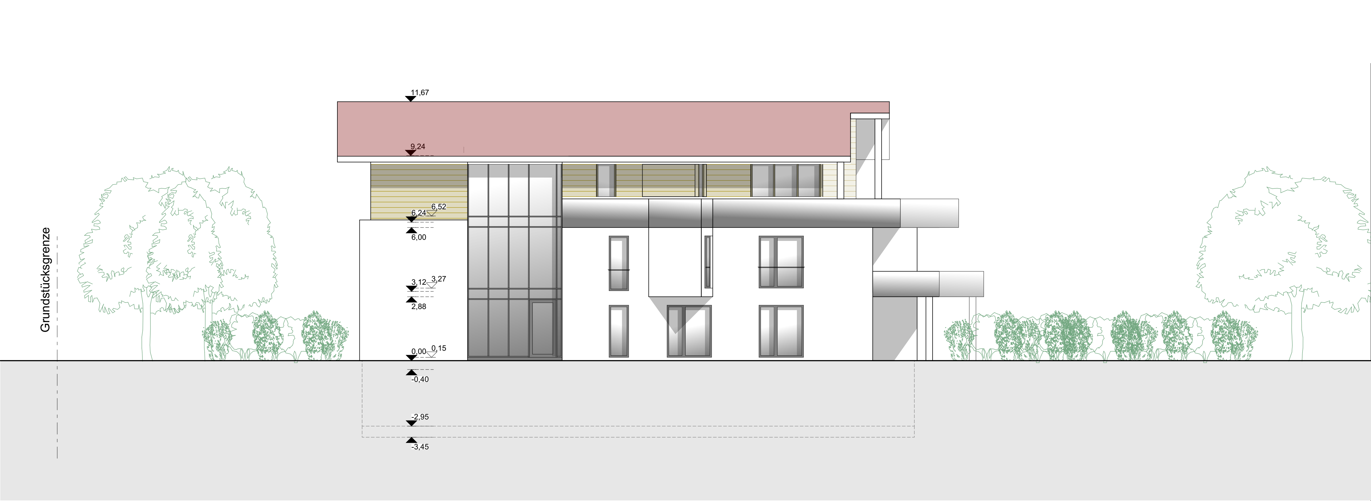
Haus B - Ansicht West