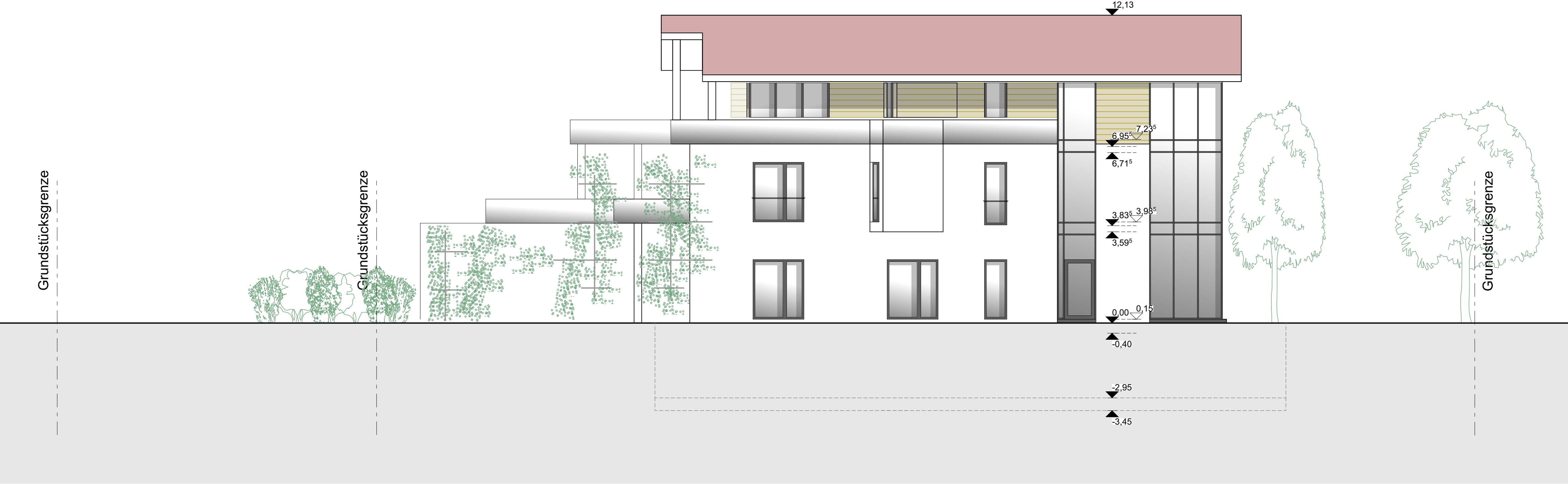
Haus A - Ansicht Ost