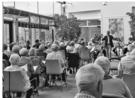
Musik und Begegnung: Konzert aus dem Programm zum Welt-Alzheimer-Tag 2024.

Das vollständige Programm ist online unter www.bodenseekreis.de/weltalzheimerstag zu finden. Es liegt außerdem in den Rathäusern im Landkreis aus oder kann beim Landratsamt unter 07541 204-5640 oder sozialplanung@bodenseekreis.de bestellt werden.