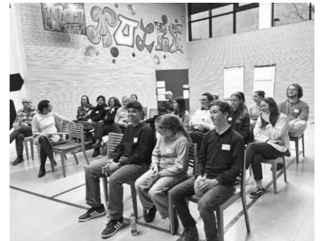
Im Jugend- und Kulturzentrum Molke in Friedrichshafen tauschten sich junge Engagierte, Vereinsvertretende und Fachkräfte darüber aus, wie sich mehr junge Menschen für freiwilliges Engagement gewinnen lassen.

buergerengagement@bodenseekreis.de oder Tel. 07541 204-5605.