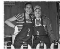
Waffelbacken beim Fest um d’Kirch (oben), Geschenk-Übergabe an die Wunschbaumaktion (unten), Spendenübergabe ans Tierheim Friedrichshafen (rechts).

(Vorsitzende Förderverein Immenstaad e.V.)